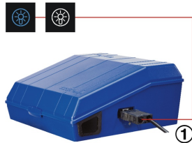
BUTTONS ON THE CONTROL PANEL TO SWITCH THE LIGHTING ON/OFF