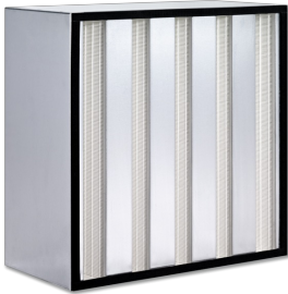
PLISSÉFILTER-CELLEN TYPE MFC