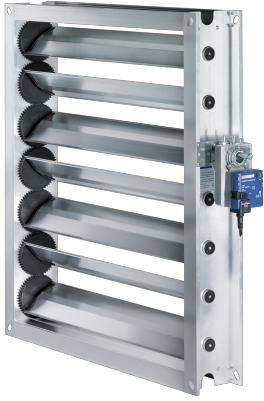
VOLET DE DOSAGE, TYPE JZ-AL