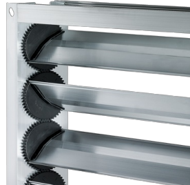
MÉCANISME À LAMELLES VIA DES PIGNONS