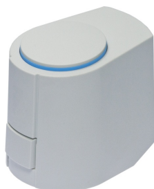
MOTEUR DE VALVE FSL- CONTROL II