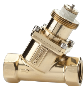
VALVE DE RÉGULATION DE PRESSION INDÉPENDANTE