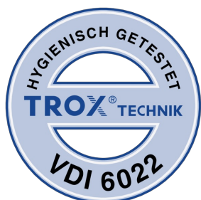
TESTÉS CONFORME À LA NORME VDI 6022