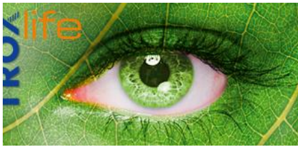
DURABILITÉ LA DURABILITÉ EST L'AVENIR.