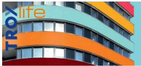
ARCHITECTURE AND DESIGN. THE ART OF DESIGNING AIR.