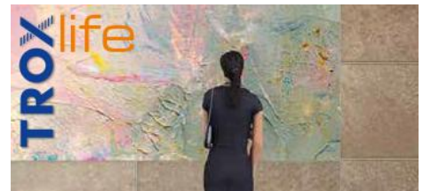
ARTS AND CULTURE. ARTFUL AIR DESIGN