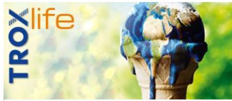
CLIMATE AND CHANGE. NEW CHALLENGES FOR THE HVAC INDUSTRY.