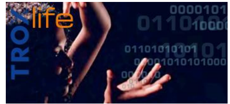
ONES AND ZEROS. DIGITAL TRANSFORMATION.