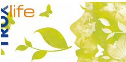
AIR AND LIFE. INDOOR LIFE QUALITY.