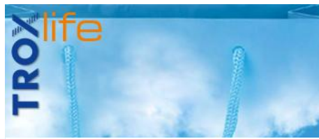
SHOPPING AIR. SHOP 'TIL YOU DROP IN FRESH ROOM AIR.