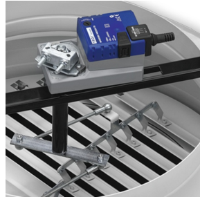
RÉGLAGE DES AILETTES À L'AIDE D'UN SERVOMOTEUR