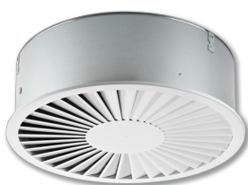
Façade circulaire avec plenum de raccordement circulaire et raccordement sur le dessus