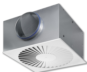
Façades carrées avec plenum rectangulaire