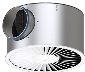
Façades circulaires avec plenum circulaire