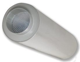
ROHRSCHALLDÄMPFER SERIE CAK