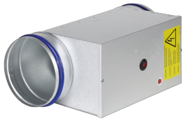
WÄRMEÜBERTRAGER SERIE EL