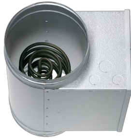
ELEKTROLUFTERHITZER MIT GLATTEN EDELSTAHLHEIZELEMENTEN

Elektrolufterhitzer mit glatten Edelstahlheizelementen