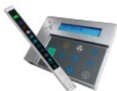
Beleuchtungsschaltung über Bedieneinheit