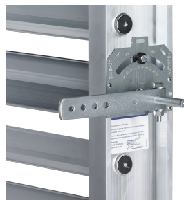
FESTSTELLVORRICHTUNG AN JZ-AL, JZ-HL-AL

Die Feststellvorrichtung befindet sich immer zwischen der ersten und zweiten Lamelle von oben