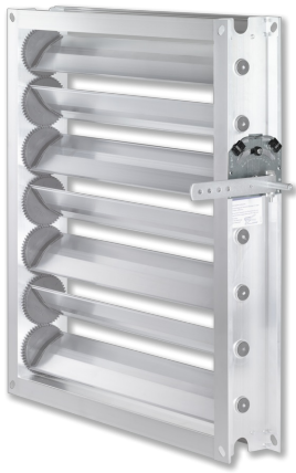
FESTSTELLVORRICHTUNG AN JZ-AL