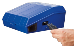
CONNECTION SOCKET FOR LIGHTING