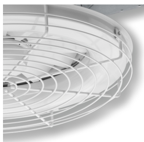
GRILLE DE PROTECTION