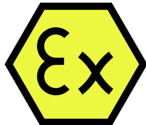
Certification ATEX Certification ATEX