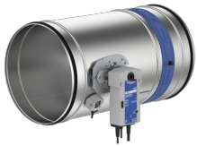
FKR-EU AVEC SERVOMOTEUR BELIMO ; RESSORT DE RAPPEL, EXÉCUTION XE0; VIROLE